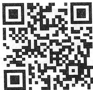
ลงทะเบียนเข้าร่วมงาน Open House

(นางสวิตตา พานเงิน) รองผู้อำนวยการสำนักงานอธิการบดี